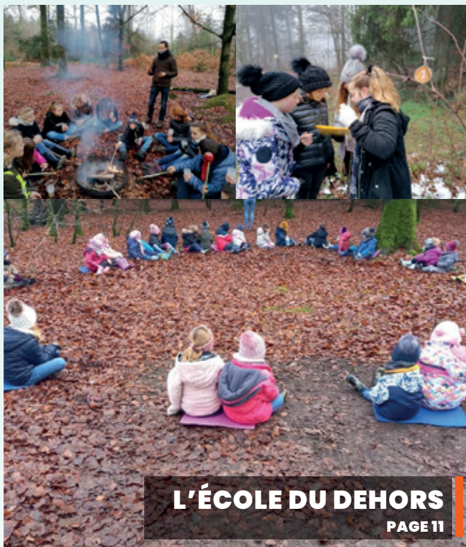
L'ÉCOLE DU DEHORS PAGE 11