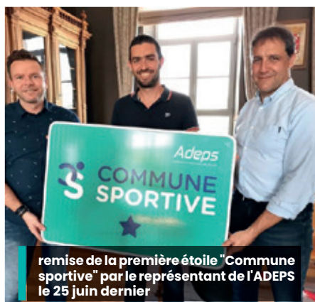
remise de la première étoile "Commune sportive" par le représentant de l'ADEPS le 25 juin dernier

À noter que notre verte Province fait figure de bon élève, puisqu'elle compte 20 Communes lauréates (sur un total de 44 Communes) ... Toujours une ardeur d'avance, et en route vers la deuxième étoile!