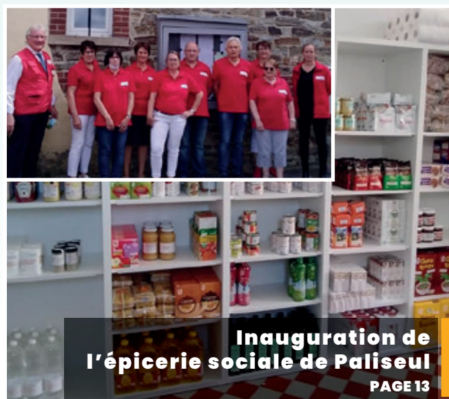
Inauguration de l'épicerie sociale de Paliseul PAGE 13