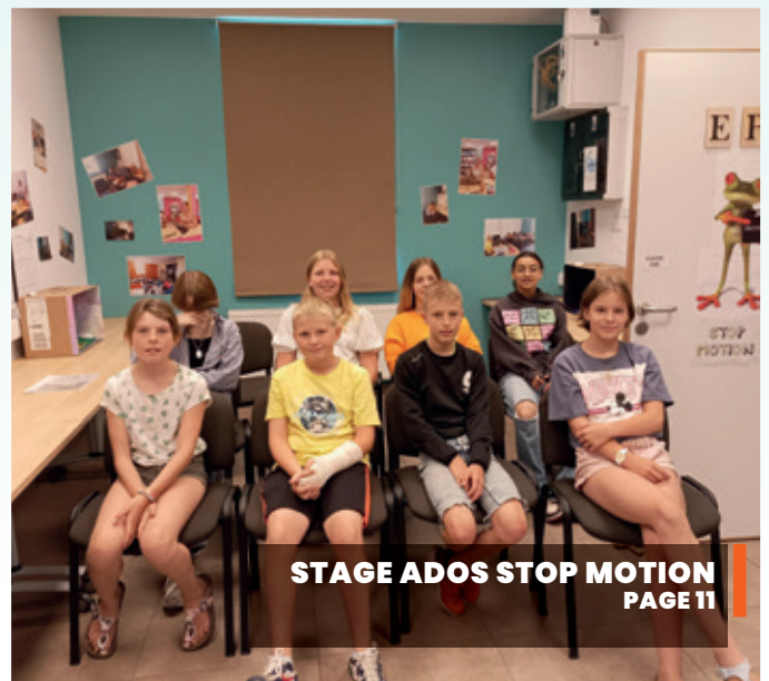
STAGE ADOS STOP MOTION PAGE 11