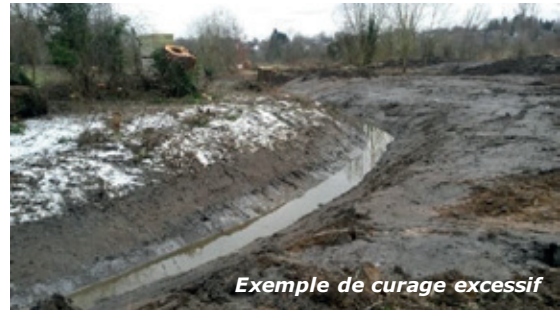
Exemple de curage excessif

Avant fin 2018, la gestion des cours d'eau non navigables était encadrée par une loi datant de 1967. L'objectif était de favoriser l'écoulement de l'eau et de garantir son évacuation le plus rapidement possible dans le but de lutter contre les inondations. Dans ce contexte, le curage des cours d'eau était une pratique courante. Aujourd'hui, cette gestion intègre l'enjeu de lutte contre