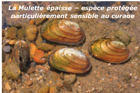
La Mulette épaisse – espèce protégée particulièrement sensible au curage

les inondations, mais également les enjeux de protection de la biodiversité, socio-économique et culturel. Le curage, en éliminant la végétation et la faune se développant dans le lit du cours d'eau, entraîne des conséquences très négatives sur les écosystèmes aquatiques. Il impacte également le fonctionnement du cours d'eau en modifiant l'alternance des méandres, la texture et les variations de profondeur et d'inclinaison des berges et du lit.