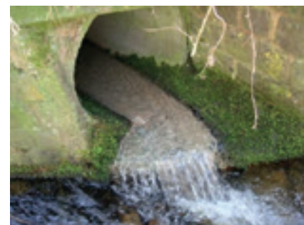
Egout se déversant directement dans le cours d'eau